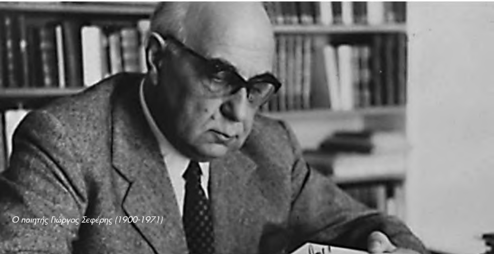
Ο ποιητής Γιώργος Σεφέρης (1900-1971)

* Το ποίημα αρχίζει με την φράση «Όπου και να ταξιδέψω η Ελλάδα με πληγώνει», που γράφτηκε το καλοκαίρι του 1936, πάνω στο ατμόπλοιο «Α/Π Αυλίσ», όπως σημειώνει ο ποιητής, «περιμένοντας να ξεκινήσει».