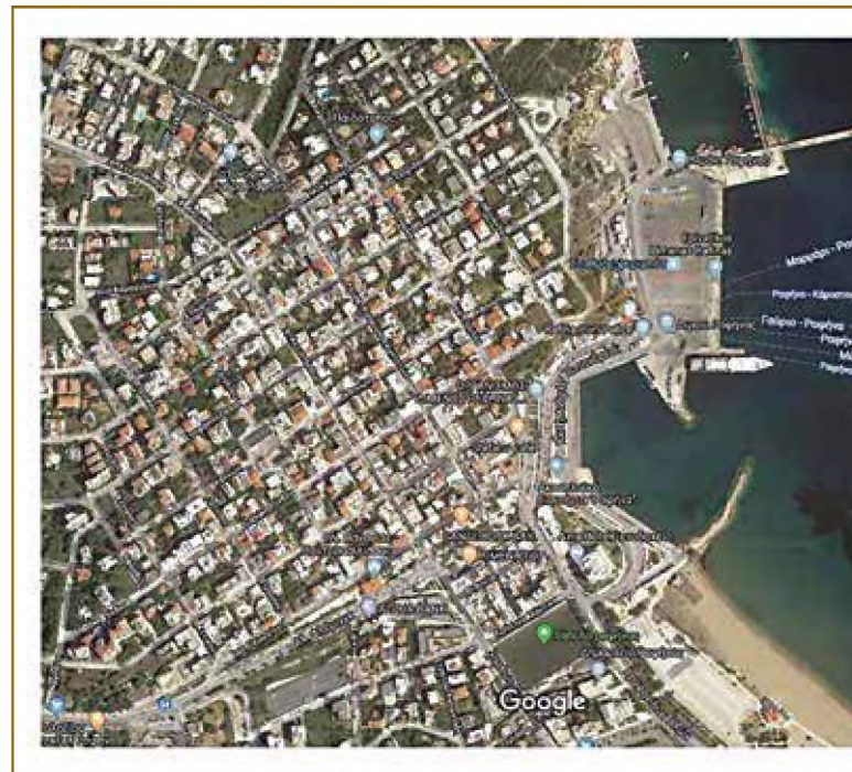
Εικόνα 1. Γεωγραφικό Πλάτος/Μήκος: 38.023445°/ 24.01164° (Google Earth, 2018)

Συνώνυμα: σκάλα (λατ. scala ), πόρτο (ιταλ. porto ) Στην μεσαιωνική Ελληνική: λιμένι